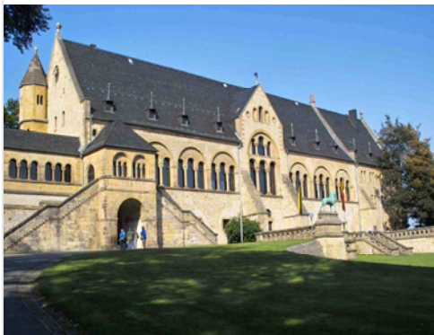
Kaiserpfalz und Pfalzbezirk und somit die Besucher Goslars können vom Konjunktur-

Dennoch müssen bei aller Fördermittel-Euphorie die Folgekosten im Auge behalten werden, um die Stadt vor bösen Überraschungen in der Zukunft